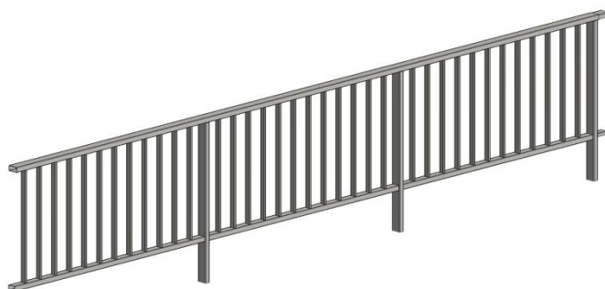
Vista 3D del módulo estándar